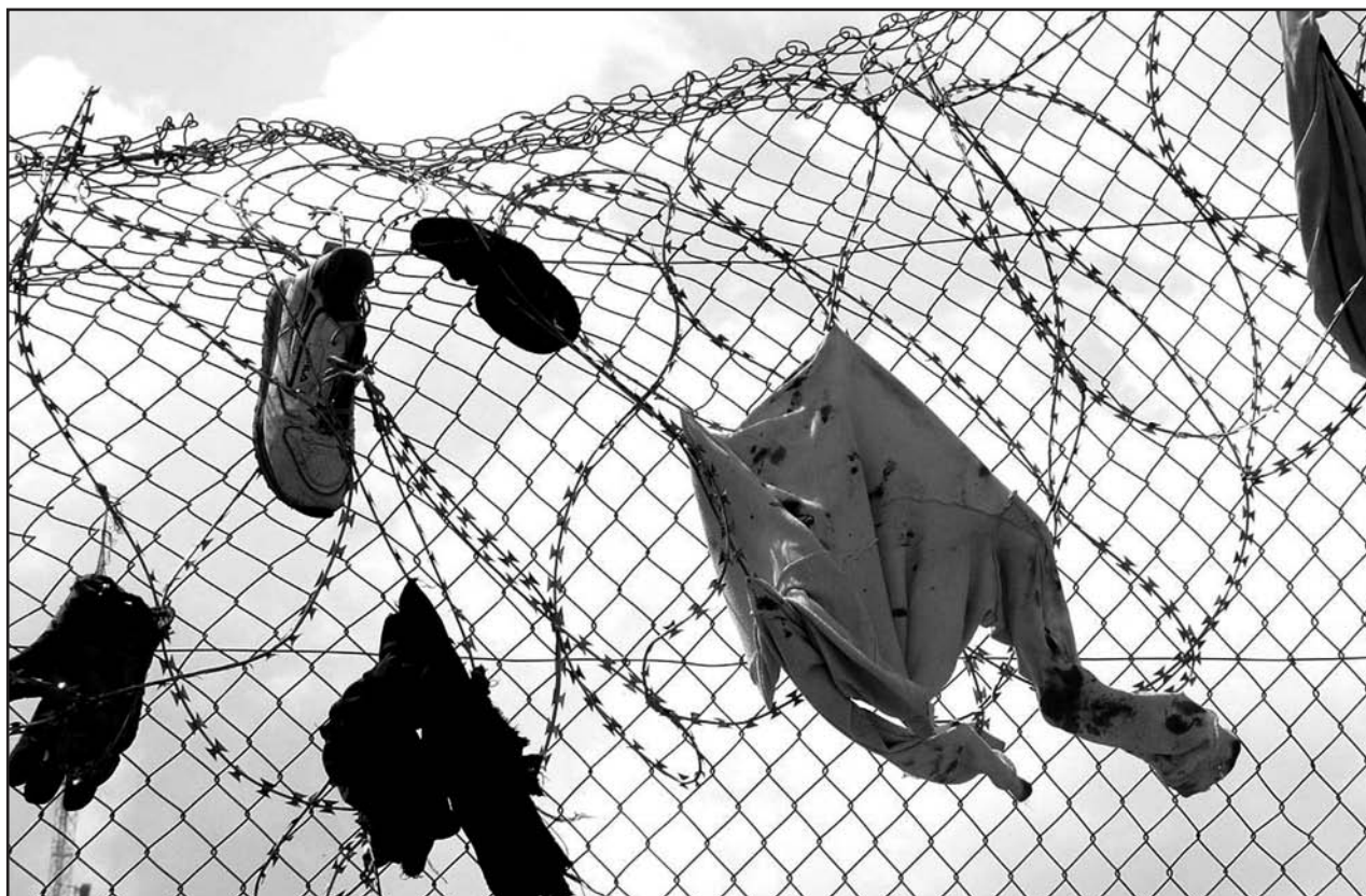
Spuren einer Flucht: Viele Flüchtlinge riskieren am Grenzzaun ihr Leben.