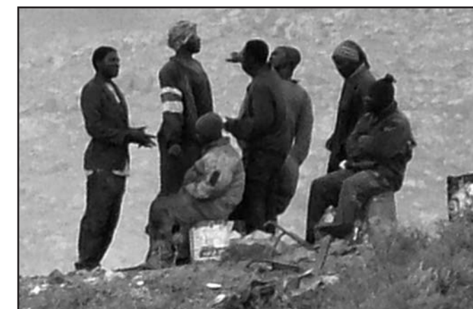
In Melilla: Selbst wer offiziell registriert ist, muss fürchten aufgegriffen und abgeschoben zu werden. Beamte der Guardia Civil gehen zuweilen sogar so weit, dass sie Registrierungskarten zerreißen.