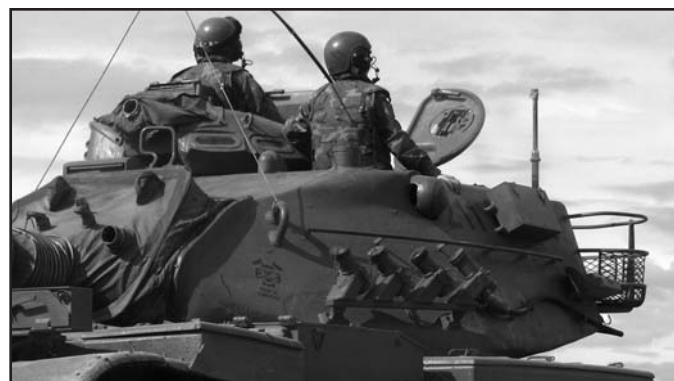
Kriegsähnliche Szenarien: Hochgerüstet wie bei einem Fronteinsatz patrouillieren spanische Soldaten an der Grenze zu Marokko.