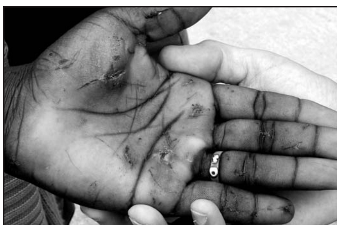
Links Marokko, rechts Spanien: Eine Grenze, die an den früheren »Eisernen Vorhang« erinnert. Auch hier kommen Menschen ums Leben. Marokkanische Grenzer schießen sogar mit scharfer Munition.