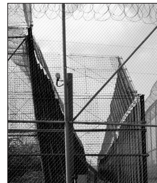
Die Grenzbefestigungen werden weiter ausgebaut: Rund um die spanische Exklave Melilla wurde der in drei Schichten gestaffelte Zaun auf eine Höhe von sechs Metern emporgezogen.

Ich sprach z.B. mit Jaques (Name geändert), der bei seiner Flucht schwer verletzt wurde. Eine Gewehrkugel traf ihn am Bein. Sein Bauch wurde durch die messerscharfen Klingen des Grenzstacheldrahts aufgeschlitzt. Beim Sturz vom Zaun brach er sich einen Arm. Über die Gewalt der Grenzbeamten auf Seiten Marokkos berichtet er: »Sie behandeln uns nicht wie menschliche Wesen. Wir müssen uns im Wald verstecken. Sie kommen, sie greifen uns an. Sie nehmen uns unsere Sachen weg – sogar das Essen, das uns gebracht wird – sie verbrennen die Laken, die Kleider... alles nehmen sie uns. Wir waren schließlich gezwungen, nach Melilla zu kommen. Leben oder sterben... «