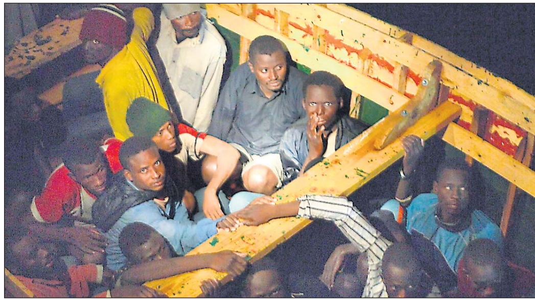
Aufgegriffen vor der Küste: Diese Flüchtlinge aus Afrika kommen in einem Holzboot auf Gran Canaria an. Die EU-Länder an den Außengrenzen schicken immer mehr Flüchtlinge zurück.

Organisation Pro Asyl dokumentiert Geschehen an den EU-Außengrenzen / Kritik an Agentur Frontex